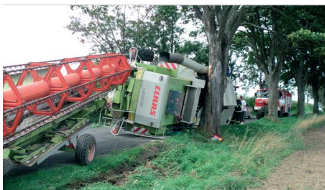
Poistná udalosť na stroji.