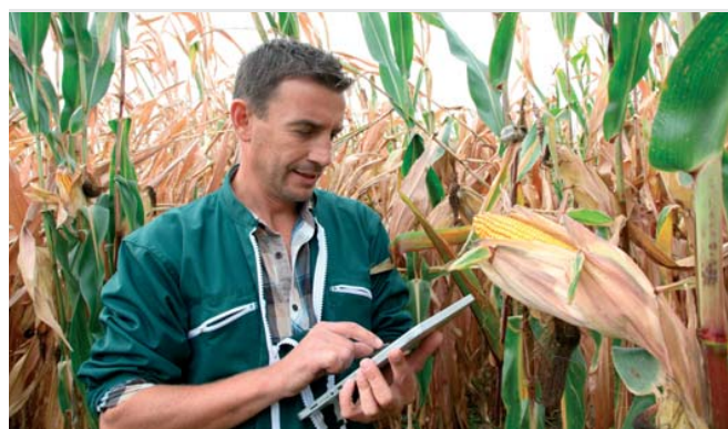
Poistná udalosť na plodinách.